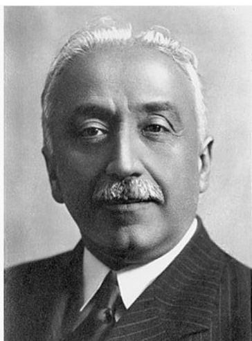
Niceto Alcalá Zamora

A aprobación dos artigos relixiosos da Constitución provocou a dimisión dos sectores católicos do goberno, polo que Manuel Azaña substituíu a Alcalá Zamora na Xefatura do Goberno.