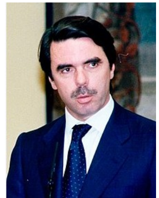
Ilustración 1 José M a Aznar

O Partido Popular, fundado en 1989 a partir de Alianza Popular e outros partidos de centrodereita, gañou as eleccións de marzo de 1996 por maioría simple. O seu líder, José María Aznar, conseguiu o apoio parlamentario de CiU, PNV e Coalición Canaria para formar Goberno. Posteriormente, nas eleccións de 2000 alcanzou a maioría absoluta de escanos nas Cortes. O triunfo desta opción política significaba a consolidación da alternancia democrática en España.