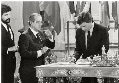
Felipe González asina o Tratado de Adhesión á CEE